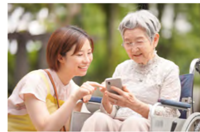
レクリエーション

塗り絵・ちぎり絵・編み物・将棋などのゲーム・家庭菜園など趣味活動やグループ活動を行います。